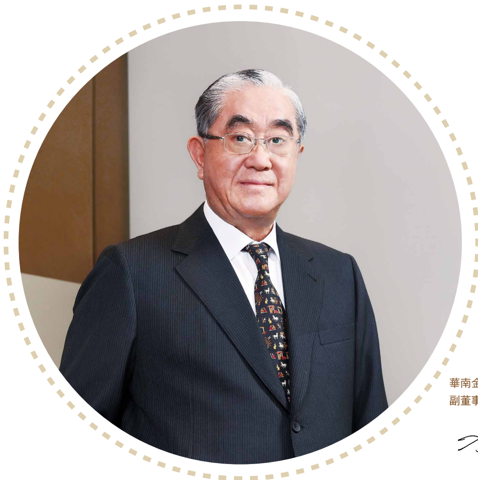
華南金融控股股份有限公司 副董事長

動能活躍，且逾放比率 0.15%，備抵呆帳覆蓋率 826.9%，資產品質表現仍佳。華南永昌證券稅後淨利 25.24 億元，經紀手續費收入及業績量年成長近 7 成，自營業務收入成長 13.9%，經紀市占率 3.26%，同業排名第 9 名。華南產險稅後淨利 9 億元，增幅達 86.7%，主要係資金運用表現突出達 6.76 億元所致；簽單保費收入為 110.65 億元，年增 9.3%，市占率 5.35%，同業排名第 7 名。