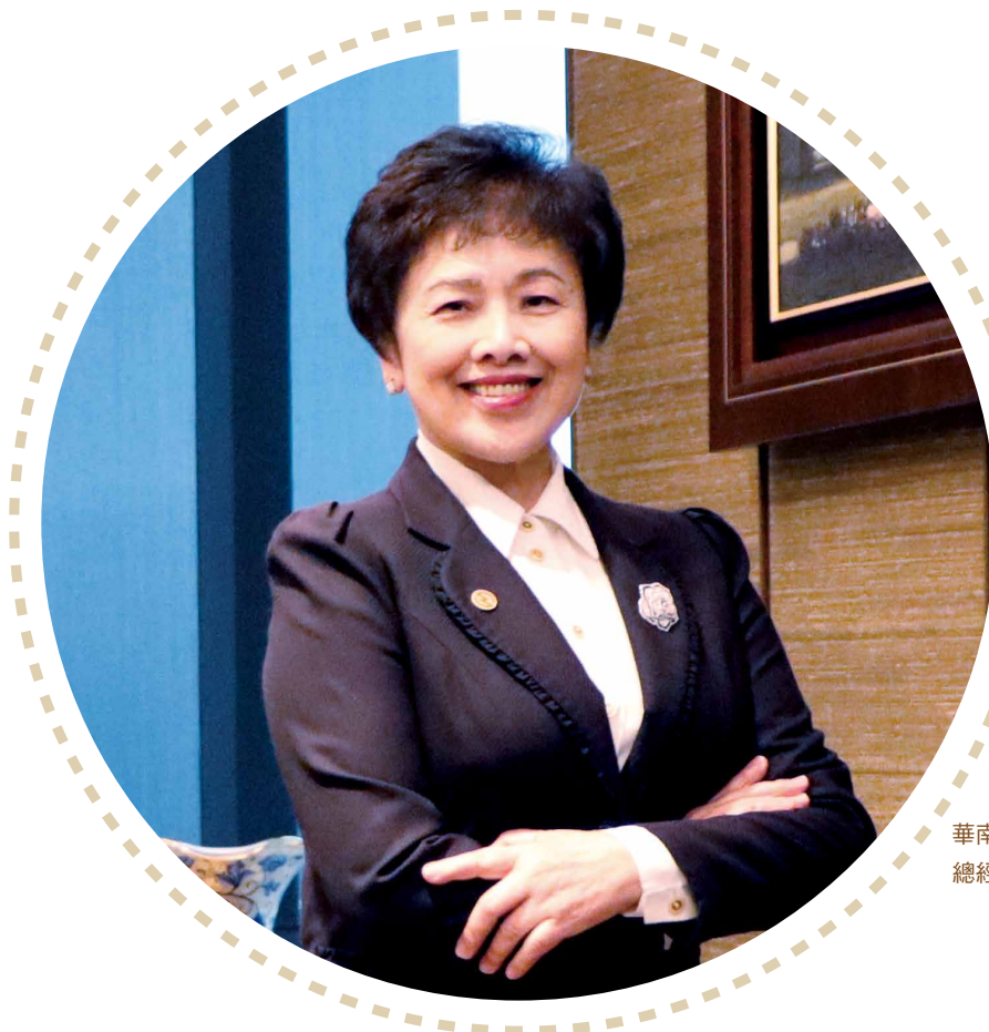
華南金融控股股份有限公司 總經理