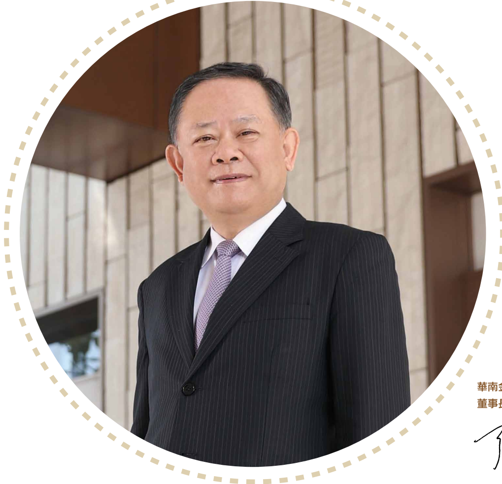
華南金融控股股份有限公司 董事長