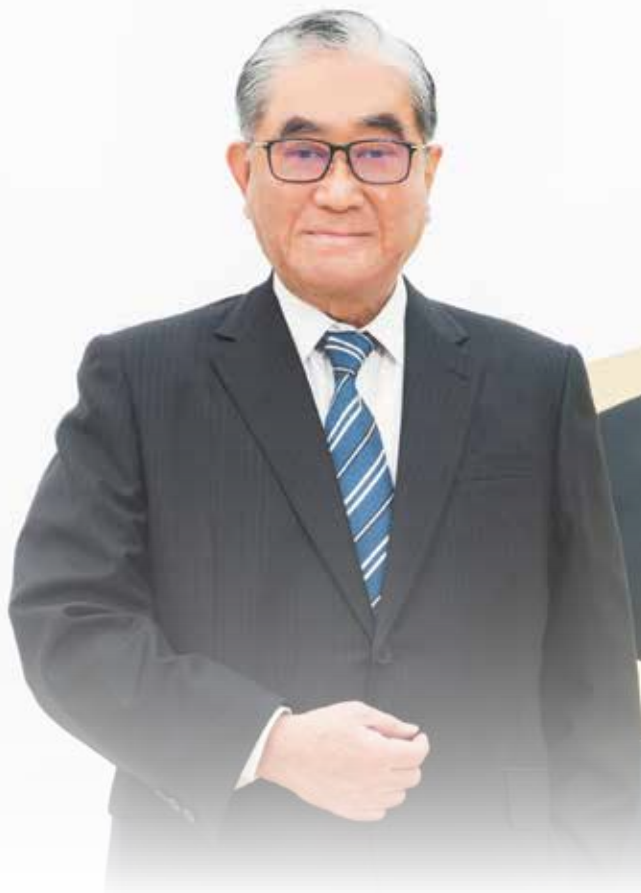
華南金融控股股份有限公司 副董事長

本集團在公司治理、綠色金融、環境永續、企業社會責任、數位金融創新及優質消費商品等面向，持續精進與努力，茲將 108 年度主要經營成果說明如下：