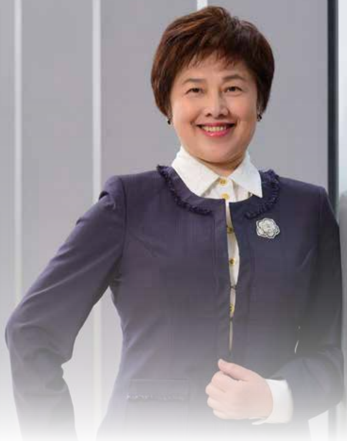
華南金融控股股份有限公司 總經理